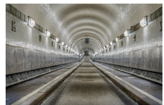
旧エルベトンネル(ドイツ)

製品改良の為、予告なしに仕様を変更することがありますので、あらかじめご了承ください。(※無断複写・転載禁止)