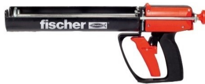
585ml 用 (手動)