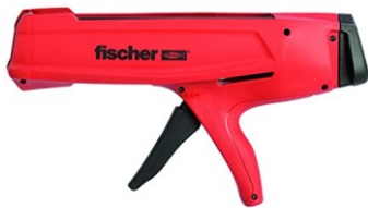
390ml 用 (手動)