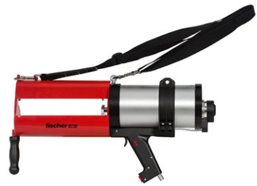
1500ml 用 (エア)