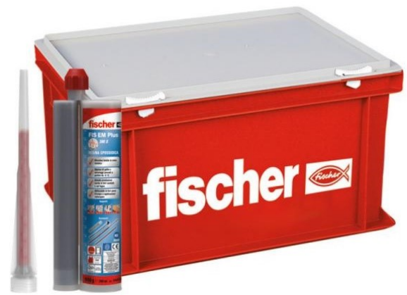
スペシャルケース入り